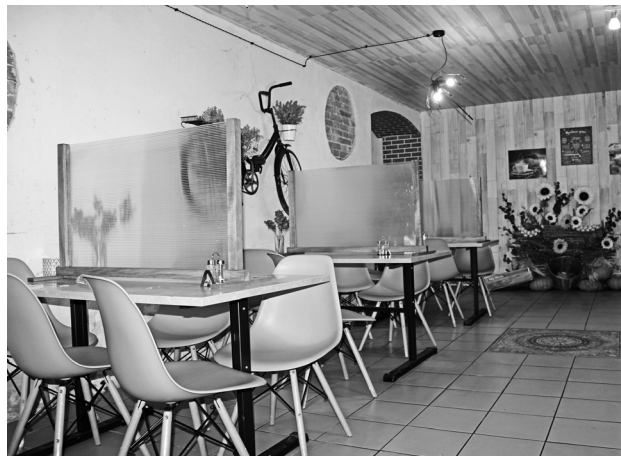
Такие перегородки установлены в «Пельменной».

В Байкалово мы насчитали три заведения общественного питания – «Трактир», «Фортуна» и «Пельменная». Перегородки есть только в «Пельменной». Они установлены прямо на столах и делят его на две части. «Мы их установили почти сразу, как вышел указ, – сообщила улыбчивая женщина на кассе. – Поначалу посетители неоднозначно встретили новшество и